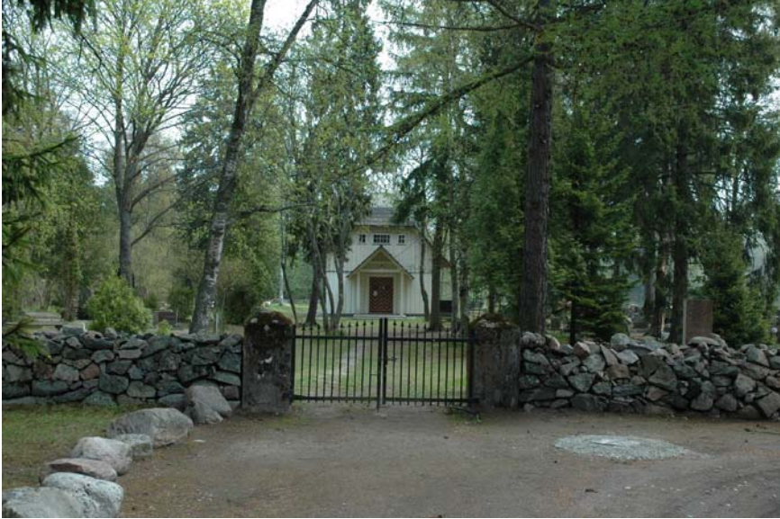
Vaade vanale kalmistule ja kabelile.

rahuldava tulemuseni, on Vallavalitsusel õigus alustada läbirääkimisi teiste auhinnaliste kohtadele tulnud tööde autoritega nende tööde teostamiseks või lõpetada üldse konkursi tööde elluviimine.