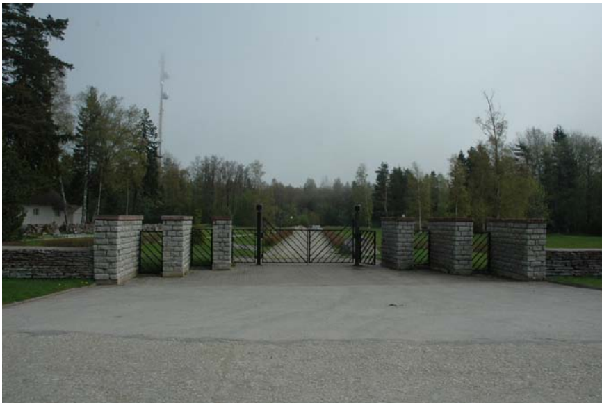
Vaade uues kalmisu sissepääsule