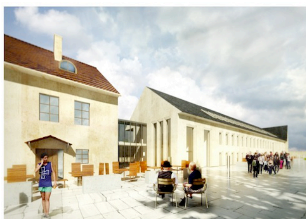
12. Vaade Kivisaali