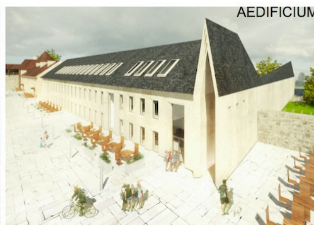
13. Vaade Kivisaali juurdeehitusel

Žürii hindas autorite julgust veidi „üle võlli“ minna ja piire kombata ning jättes piirangud ja tingimused kõrvale, on tegu huvitava ja ambitsioonika tööga. Žürii tõstab positiivselt esile ka kavandis pakutud „lastetorni“ lahendust. Ent võistlustöö ei lahendanud liikuvuse probleeme, mis oli konkursi olulisemaid eesmärke ning arhitektuurikeel mõjus kokkuvõttes veidi raskepäraselt.